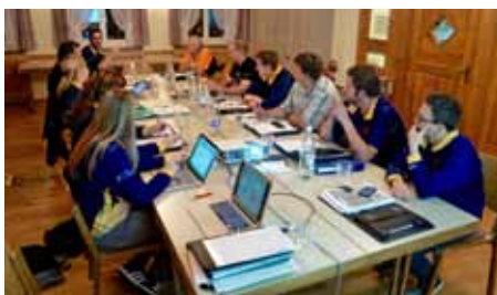
Das OK bei der Arbeit

Das Fest wird an zwei nahe beieinanderliegenden Orten im Dorf Kirchberg stattfinden: Auf dem Fussballplatz werden die 1'000 Meter Läufe und die Wurfdisziplinen durchgeführt. Auch für Verpflegung ist an diesem Platz gesorgt. Auf dem Hauptgelände rund um die Schulhäuser Lerchenfeld und Sonnenhof werden alle anderen Disziplinen, sowie die offiziellen Teile des Festes durchgeführt. Die Verpflegung der Teilnehmer und das Festzelt werden ebenfalls auf dem Hauptgelände zu finden sein. Die beiden Plätze sind zu Fuss rund 5 Minuten voneinander entfernt. Parkplätze für Teilnehmer, Helfer und Besucher sind vorhanden, es wird jedoch gebeten, wenn möglich mit dem öffentlichen Verkehr oder in Fahrgemeinschaften anzureisen, um das Verkehrsaufkommen im Dorf in einem für die Anwohner erträglichen Rahmen zu halten.